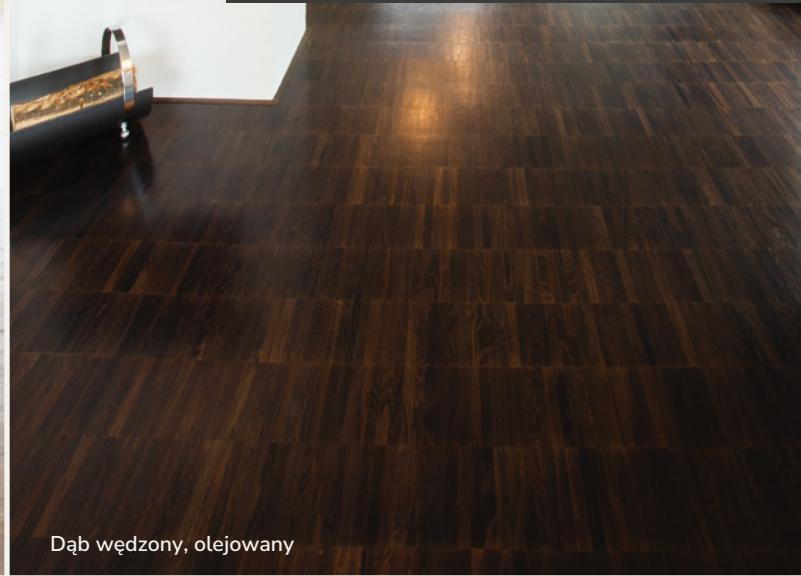
Dąb wędzony, olejowany

Parkiet ten jest propozycją dla biur i pomieszczeń administracyjnych, sal konferencyjnych, muzeów, szkół. Jednak ze względu na swoją trwałość i możliwość doboru odpowiedniej kolorystyki, bardzo często wykorzystywany jest przez architektów w zabytkowych obiektach. Bez względu, czy to obiekt komercyjny czy prywatne mieszkanie, stworzy efektowne i oryginalne wnętrze.