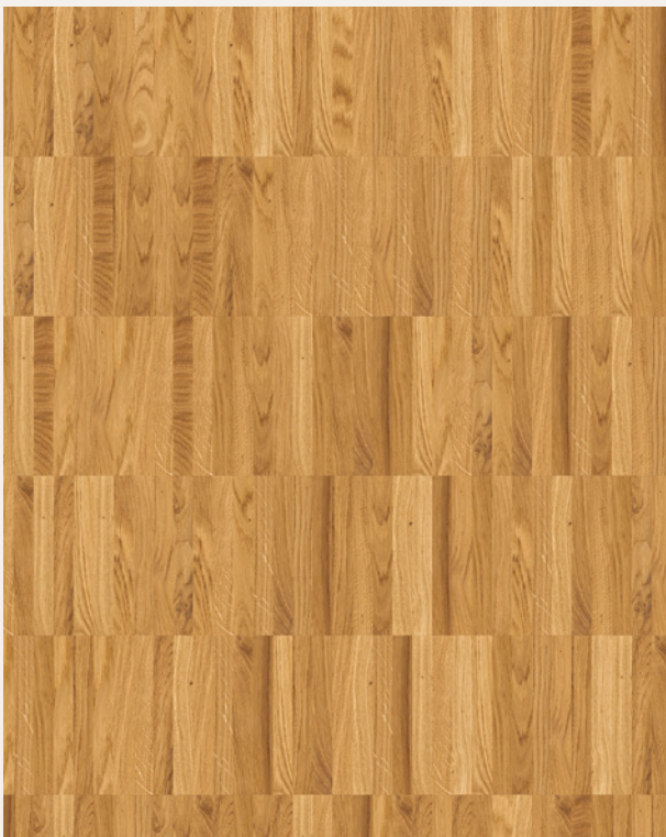
Dąb Markant szpachlowany ♦ olejowany