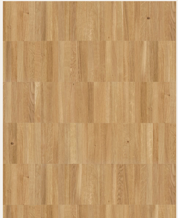
Dąb Mix szpachlowany ♦ olejowany