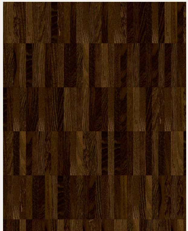
Dąb Wędzony szpachlowany ♦ olejowany