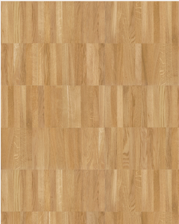
Dąb Hell szpachlowany ♦ olejowany