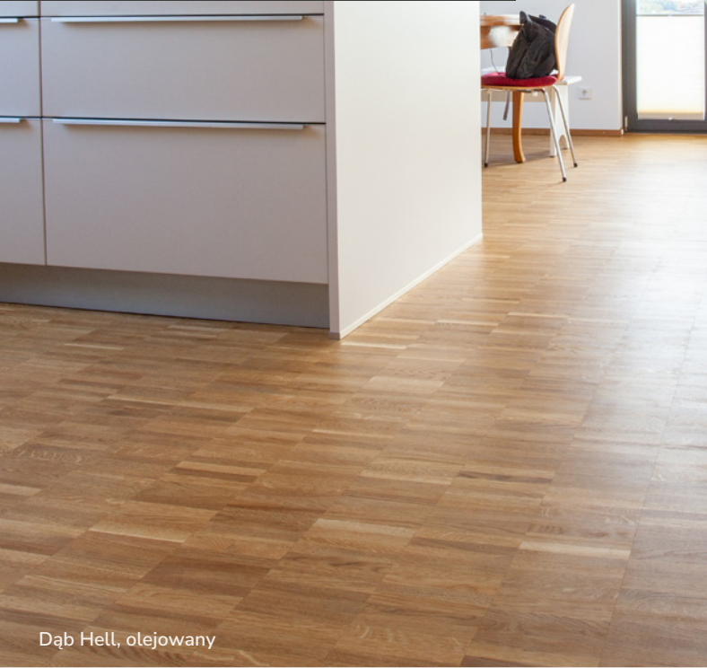
Dąb Hell, olejowany

Solidny i wytrzymały parkiet lamelowy, jego grubość to 18 mm, łatwy w utrzymaniu czystości i pielęgnacji. Odpowiednio ułożone Stabilette to sprytny sposób na optyczne powiększenie pomieszczenia.